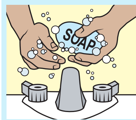
شستن مکرر دستها