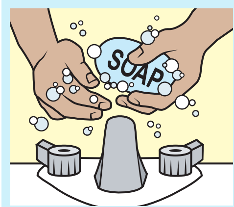
លាងដៃ ញឹកញាប់