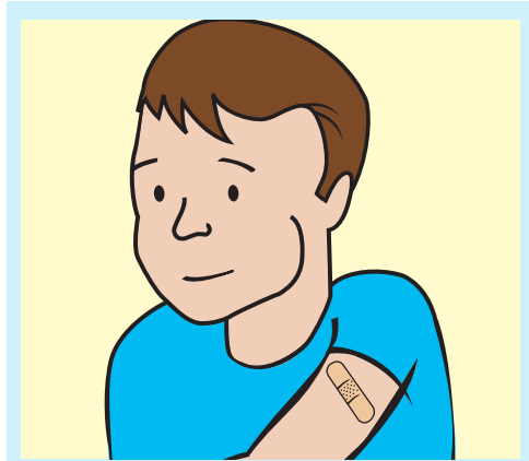
รับการฉีดวัคซีน