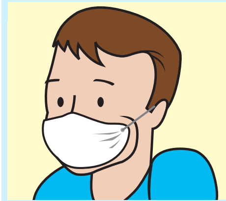
Che miệng khi ho và hắt hơi