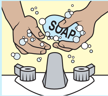
Rửa tay thường xuyên